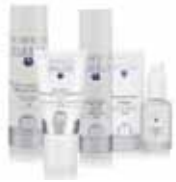
ALCINA Haircare N° 1

Haarschnitte für Damen, Herren & Kinder Diverse Meches-Techniken Moderne Haarfarben Hochsteckfrisuren Kopfmassage Dauerwelle Chemisches Haarestrecken Spielecke für Kinder