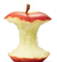
Für den Schlussakt