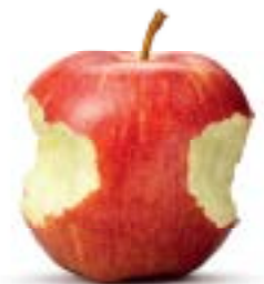
Für die Romanze