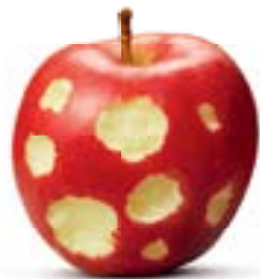
Für die Improvisation