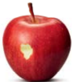
Für die Nebenrolle