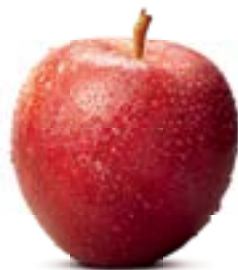
Für die Premiere