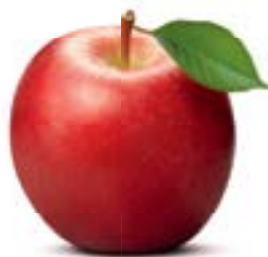
Für das Bühnenbild