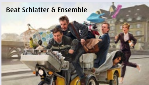
Beat Schlatter & Ensemble

Wir bieten als Gastgeber & Partner des Herbsts auch dieses Jahr wieder