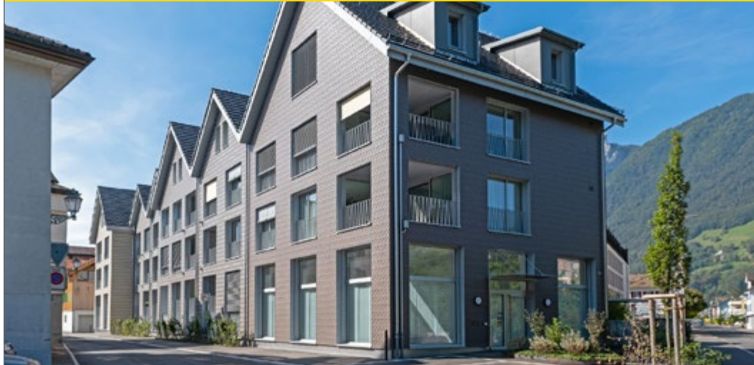
Architektur & Holzbau als Gesamtleistung