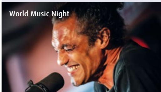
World Music Night